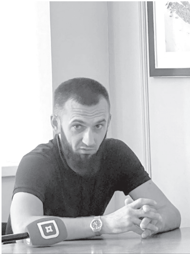
шырыгъыл' вухъа. Манбы позициябы ут'умаъас хъигъебч'ы вухъа.

Руслан шаца сентябрьни вуза мобилизацияейхъа гирхъу. Манбы джони гъамбазаршиква саджигее сабара гагъна Чечнай' гъа'зирийвалла илгъевч'у. Манчиле хъийгъа СВО ал'гъаани джигейхъа о'тиравъу. Мана командирни ха'рынкъуна шофир ыхъа. Манбы гъаммаше саджигее воохы вухъа. Камикадзе дрон манбышди машнелхъа къайидхъуйнкъа, джо тап-