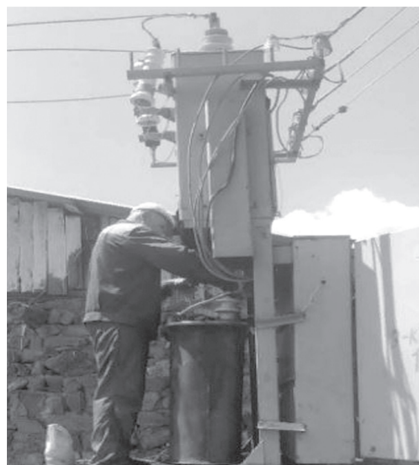
Сабара вахтна гыхъа Цахъи хивни трансформатарыс йилдырым ыхы. Ыхъайни фалыкатын

Гъайни сен Цахъыйни дерайл' къыл' гегъуйбышика алгъаал. Экъда-экъда гегъани гегъуйбыше инсанаршис диндж гъели деш.