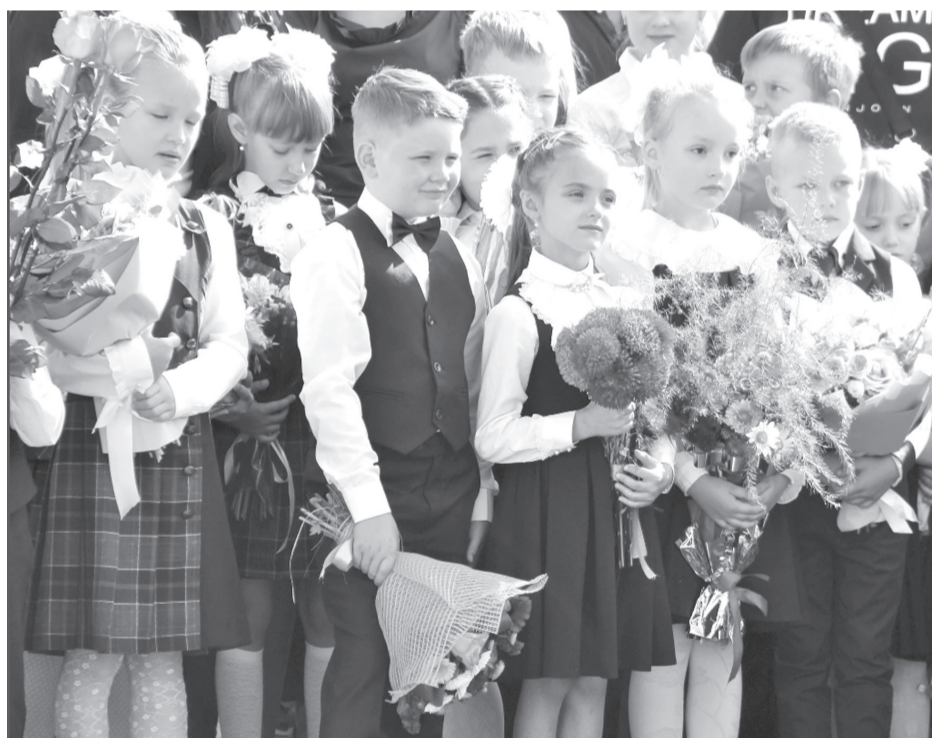
Хил'дже вахтний маьаллимын гьаргьанкьаь маьаллимийвалла саьнаьат гъаьс хаьббананбыше гъаьс вуккананбышис шараитбы

джан айгьи ыхъа деш. Россияни Президенте Владимир Путине 2023 сен маьаллимын ва наьсигъатчийн сен эьлан гъау. Гъаьшде